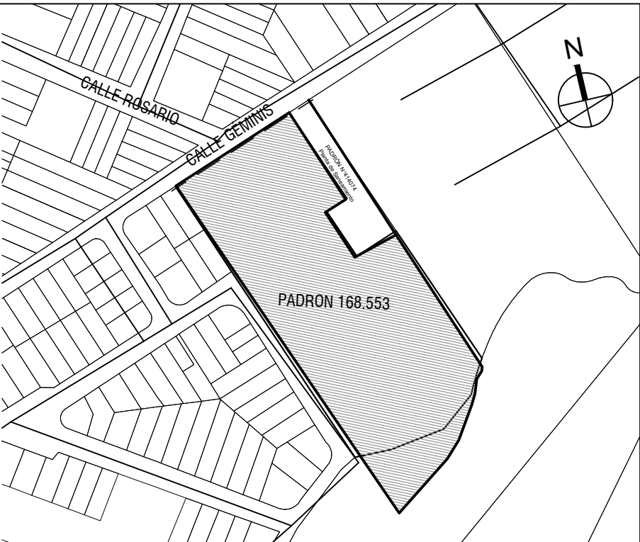
PLANO DE UBICACIÓN escala 1/4000